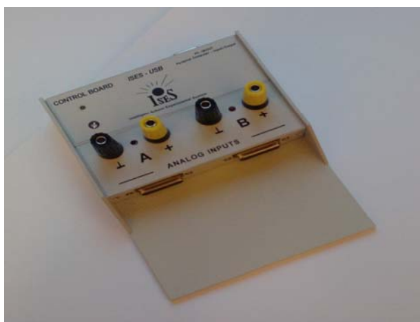
Soupravu ISES USB

Souprava ISES USB je 12 bit. Do počítače připojena přes USB rozhraní. Souprava má 2 analogové vstupní kanály a 5 digitálních výstupů (např. pro ovládání relé aj.). Připravujeme ISES-USB se 2 analogovými vstupními kanály a 1 analogovým výstupním kanálem a 2 digitálními vstupy/výstupy. Vzkovovací frekvence ISES-USB je max. 100 kHz