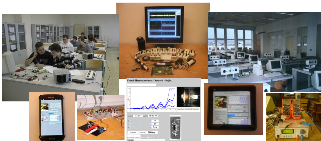
Souprava ISES ve škole, v laboratoři a na Internetu

Měřicí a laboratorní studio iSES (iSES – internetové školní experimentální studio) je široká otevřená platforma, která umožňuje měření a řízení experimentů s podporou počítačů a internetu. Měřicími komponentami jsou soupravy ISES (ISES-USB nebo ISES-LAN nebo ISES-WIN aj.), měřicí přístroje s USB, či COM konektivitou do počítače a v neposlední řadě též Arduino komponenty. Dále samozřejmě senzory pro Fy Che a Bi a program ISESWIN pro lokální měření, případně softwarová stavebnice iSES Remote Lab SDK pro tvorbu vlastních vzdálených experimentů.